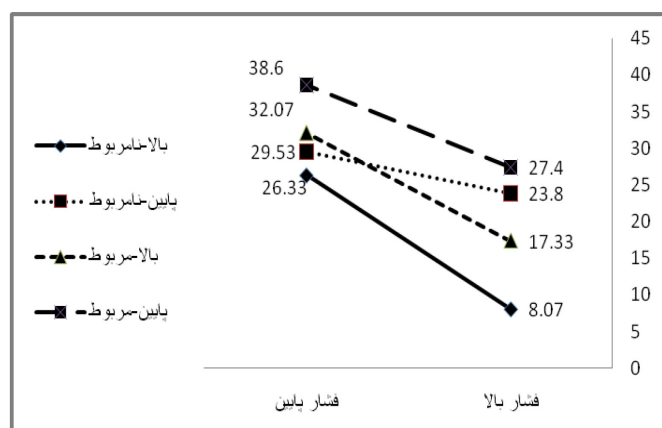
نمودار ۲- میانگین اجرای آزمودنی‌ها در شرایط فشار در مهارت دفاع تک به تک

چهار گروه در شرایط فشار در مهارت دفاع تک به تک را نشان می‌دهد.