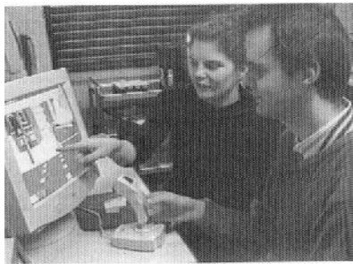
شکل ۱ - کاربری محیط‌های مجازی

بنابراین در یک محیط مجازی مثل سوپرمارکت (شکل شماره ۲) کاربر قادر است تا در میان ردیف‌ها و قفسه‌های اشیا با کمک دسته یا کلیدهای عقب و جلو صفحه کلید حرکت کند؛ و اشیای مورد نظر را از قفسه‌ها، با فشردن موشواره یا تماس روی صفحه حس گر انتخاب