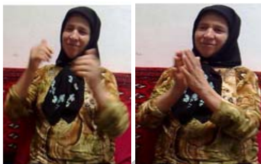
(ب) نشانه رقصیدن

۷- ابزار فضا: با توجه به ماهیت مکانی-فضایی عالم خارج و با توجه به اینکه زبان اشاره به خوبی می تواند این ویژگی را منتقل کند، ابزار فضا نقش بسیار موثری در برخی نشانه ها ایفا می کند. در این نشانه ها فضایی که دست ها ایجاد می کنند، به گونه ای با خود مفهوم ارتباط می یابد. به طور کلی این ابزار را می توان به دو شاخه ی اصلی تقسیم کرد: