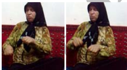
شکل (۱۰) نشانه دوچرخه

(ث) ابزار حرکت جهت نمایش تکرار: در برخی از نشانه‌ها حرکت موجود در مفهوم به صورت مکرر تولید می‌شود تا به عنوان مشخصه‌ای معنایی در بازشناسایی مفهوم به مخاطب یاری کرده باشد. برای نمونه در نشانه‌ی دوچرخه (شکل ۱۰) تکرار حرکت دورانی دست‌ها که نمایش حرکت پاهاست، حکایت از تکرار رکاب زدن در دوچرخه سواری است.