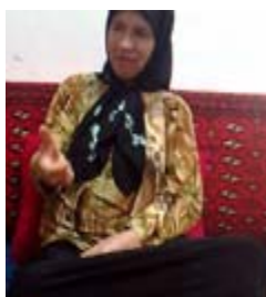
شکل (۹) نشانه‌ی مگنه

(ث) ابزار حرکت جهت نمایش تکرار: در برخی از نشانه‌ها حرکت موجود در مفهوم به صورت مکرر تولید می‌شود تا به عنوان مشخصه‌ای معنایی در بازشناسایی مفهوم به مخاطب یاری کرده باشد. برای نمونه در نشانه‌ی دوچرخه (شکل ۱۰) تکرار حرکت دورانی دست‌ها که نمایش حرکت پاهاست، حکایت از تکرار رکاب زدن در دوچرخه سواری است.