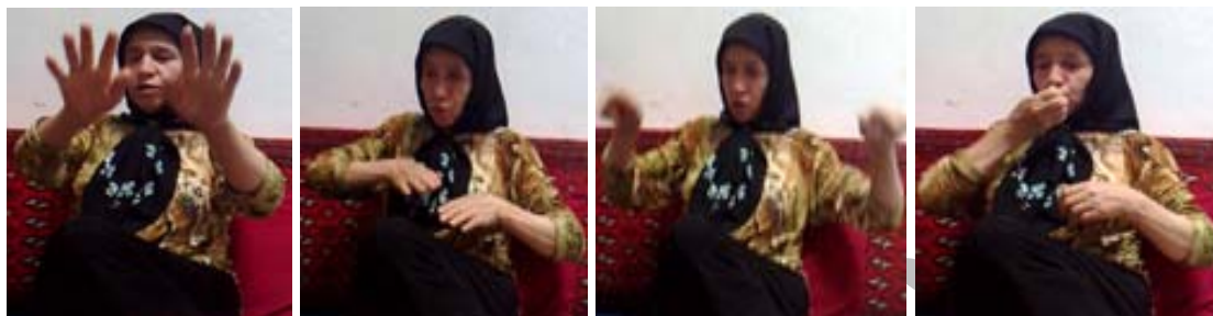
(الف) نشانه استخر

برای نمونه در نشانه‌ی استخر (شکل ۲۶ الف) دست‌ها در جهت افقی حرکت می‌کنند و بدین‌وسیله افقی بودن سطح استخر نسبت به اشاره‌گر را نمایش می‌دهند. در مقابل در نشانه‌ی تخته‌سیاه (شکل ۲۶ ب) جهت دست‌ها موقعیت عمودی تخته‌سیاه را برجسته می‌کنند.