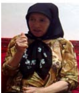
شکل (۲) نشانه تنگ

(پ) ابزار شکل جهت نمایش اندازه‌ی مفهوم: برخی مواقع برای شناساندن یک مفهوم به اندازه آن می‌توان اشاره کرد. در واقع نمایش اندازه یک مفهوم خود ابزاری است که در به تصویر کشیدن آن مفهوم می‌تواند بسیار مفید باشد. برای نمونه در نشانه جارودستی (شکل ۳) کف دست چپ همزمان با نمایش شکل جارودستی، اندازه تقریبی آن را نیز به تصویر می‌کشد.