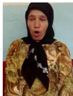
(الف) نشانه گربه