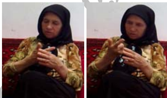
شکل (۱) نشانه پوست کردن

۱- ابزار شکل: در بسیاری از نشانه‌ها شکل دست‌ها اطلاعات گوناگونی از مفهوم مورد نظر به مخاطب می‌دهد. بر همین اساس نمایش تصویرگونه‌ی شکل مفاهیم از مهمترین ابزارهایی است که زبان‌های اشاره از آن استفاده می‌کنند. (الف) ابزار شکل جهت نمایش شکل مفهوم: در این مورد اعضای بدن به ویژه دست‌ها شکل مفهوم مورد نظر را نمایش می‌دهند. لازم به ذکر است که در بسیاری از نشانه‌ها دست شکل جزئی از مفهوم مربوط را نمایش می‌دهد و مفهوم را به صورت یک کل بازسازی نمی‌کند. برای نمونه در نشانه‌ی پوست کردن (شکل ۱) انگشت سبابه دست راست نمایش چاقو است نه نمایش پوست کردن.