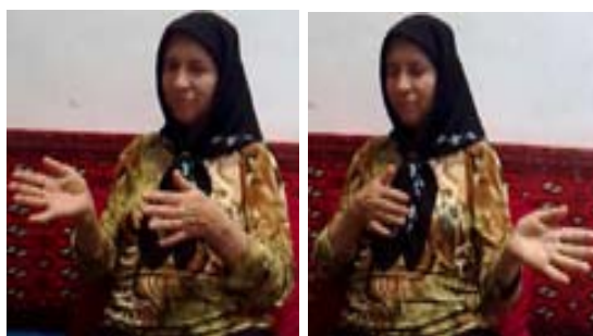
شکل (۱۴) نشانه الک کردن

(ب) ابزار زمان جهت نمایش تناوب حرکت مفهوم: در بعضی نشانه‌ها حرکت دست‌ها که نمایش‌گر حرکت مفهوم است - مانند نشانه راه رفتن (شکل ۱۵) می‌بایست به صورت متناوب انجام شود. به عبارت دیگر در صورتی که دست‌ها که نمایش پاها هستند، به صورت همزمان حرکت کنند، مفهوم دیگری (پريدن) بوجود خواهد آمد.