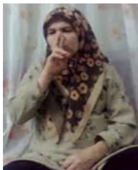
شکل (۵) نشانه سیگار

(ث) ابزار شکل جهت نمایش عضو یا اعضای بدن: در برخی نشانه‌ها اعضای بدن نمایش اعضای بدن انسان می‌باشد. در این موارد دست‌ها نمایش‌گر خود دست‌ها به هنگام انجام کار یا فعالیتی مرتبط با مفهوم مربوط هستند. برای نمونه در نشانه سیگار (شکل ۵) دست راست شکل دست را به هنگام نگه داشتن و کشیدن سیگار نمایش می‌دهد.