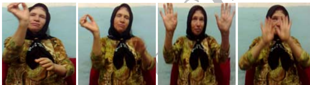
(ب) نشانه تخته‌سیاه