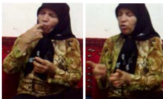
(الف) نشانه شیشه شیر بچه

(ب) ابزار فضا جهت نمایش اندازه مفهوم: این ابزار زمانی به کار می‌رود که اندازه مفهوم از طریق ایجاد فضایی میان دست‌ها (و یا انگشتان) نمایش داده می‌شود. برای نمونه در نشانه مرکب شیشه شیر بچه (شکل ۲۳ الف) که از دو بخش شیشه شیر + مکیدن تشکیل شده است، برای نمایش شیشه شیر از طریق ایجاد فضا میان دو انگشت سبابه، به اندازه آن اشاره شده است. در برخی نشانه‌ها نیز اندازه مفهوم از طریق ایجاد فضا بین دست و شئی دیگر نمایش داده می‌شود. برای نمونه در نشانه‌های بلند و کوتاه (شکل ۲۳ ب و پ) میان یک دست و زمین فضایی ایجاد می‌شود که اندازه مفهوم را نمایش می‌دهد.