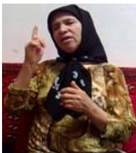
شکل (۱۹) نشانه اول

(ب) ابزار آوایی لغوی: به هنگام تولید برخی نشانه‌ها، اشاره‌گر صدایی تولید می‌کند که در واقع صورت گفتاری آن نشانه در زبان گفتاری است که به صورت تقلیدی فراگرفته است. برای نمونه در نشانه‌ی اول (شکل ۱۹) به همراه نمایش عدد یک با انگشت سبابه، صدایی مشابه avval, تولید می‌کند.