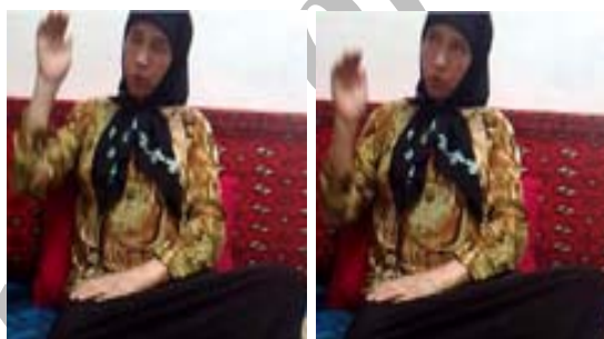
(الف) نشانه هو/پیما

(الف) ابزار جهت برای نمایش جهت حرکت مفهوم: در بسیاری از مفاهیم نمایش جهت حرکت نیز نقش مهمی در تداعی معنای مفهوم مورد نظر بر عهده دارد. برای نمونه در نشانه‌ی هو/پیما (شکل ۲۵ الف) جهت بالا و در نشانه‌ی افتادن (شکل ۲۵ ب) جهت پایین مسلماً اطلاعات بسیار باارزشی از معنای مفهوم مورد نظر را به مخاطب می‌دهد.