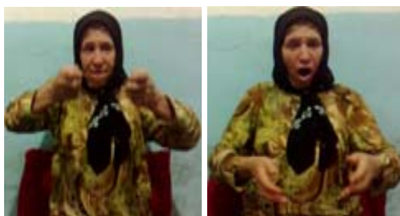
(الف) نشانه سنگین