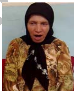
(ب) نشانه سگ

۵- ابزار آوایی: هنگامی که اشاره‌گر برای شناساندن یک مفهوم صدایی را تولید می‌کند که به نوعی با مفهوم مورد نظر در ارتباط است، از ابزار آوایی استفاده کرده است. این ابزار خود به سه زیر شاخه تقسیم می‌شود. (الف) ابزار آوایی مفهومی: زمانی که مفهوم مورد نظر صدای خاصی را تولید می‌کند. برای نمونه نشانه گربه (شکل ۱۸ الف) با تقلید نسبی صدای گربه و نشانه سگ (شکل ۱۸ ب) با تقلید صدای سگ نشان داده می‌شود.