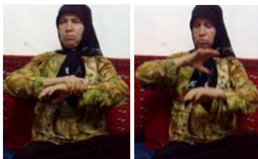
شکل (۱۶) نشانه دستبند

(ب) ابزار جا و مکان جهت نمایش محل مرتبط به مفهوم (با اشاره): گاهی اوقات برای مشخص کردن محل مرتبط با مفهوم مورد نظر به طور مستقیم به آن محل اشاره می‌شود. برای نمونه در نشانه زیبا (شکل ۱۷) که در واقع نشانه‌ای است مرکب از صورت + خوب، برای نمایش صورت به صورت خود اشاره می‌کند.