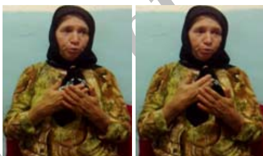
شکل (۱۳) نشانه دعوا کردن

(ح) ابزار حرکت جهت نمایش کیفیت مفهوم: در برخی نشانه‌ها حرکت دست‌ها برای نمایش کیفیت مفهوم به کار می‌رود. برای نمونه در نشانه دعوا کردن (شکل ۱۳) حرکت مستقیم دست راست به سمت پایین و در جهت دست چپ کیفیت وجود برخورد میان طرفین دعوا را به تصویر می‌کشد.