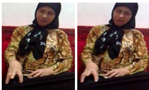
شکل (۷) نشانه لاک پشت

(پ) ابزار حرکت جهت نمایش حرکت مفهوم: بسیاری از مفاهیم دارای حرکت هستند. نمایش حرکت مفاهیم ابزاری است بسیار کارآمد برای اشاره به یک مفهوم. از همین جهت بسیاری از نشانه‌های تولید شده بر اساس نوع حرکت مرتبط با مفهوم شکل گرفته‌اند. برای نمونه در نشانه‌ی کانگرو (شکل ۸ الف) حرکت جهشی و در نشانه‌ی مار (شکل ۸ ب) حرکت زیگزاگ به تصویر کشیده شده است.