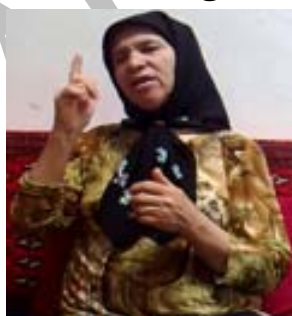
(ب) نشانه‌ی شنبه

(ت) ابزار شکل نمایش عدد: این ابزار برای نمایش مفاهیم عددی به کار می‌رود. برای نمونه زمانی که عدد دو (۴ الف) را با دو انگشت و نشانه شنبه (شکل ۴ ب) را با یک انگشت نشان می‌دهد، در واقع از ابزار عدد استفاده کرده است.