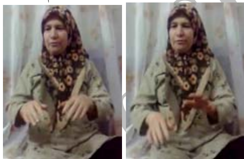
شکل (۱۵) نشانه راه رفتن

(ب) ابزار زمان جهت نمایش تناوب حرکت مفهوم: در بعضی نشانه‌ها حرکت دست‌ها که نمایش‌گر حرکت مفهوم است - مانند نشانه راه رفتن (شکل ۱۵) می‌بایست به صورت متناوب انجام شود. به عبارت دیگر در صورتی که دست‌ها که نمایش پاها هستند، به صورت همزمان حرکت کنند، مفهوم دیگری (پريدن) بوجود خواهد آمد.