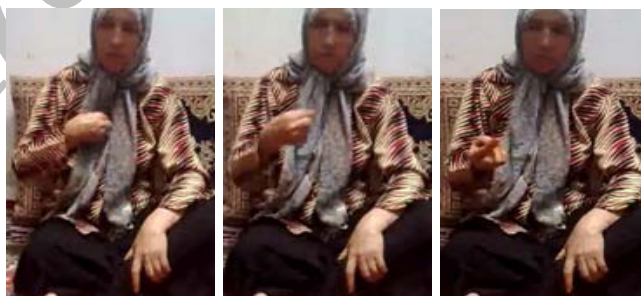
شکل (۱۱) نشانه دکمه

(ج) ابزار حرکت جهت نمایش عدد: در برخی از نشانه‌ها حرکت دست حرکت مفهوم یا اعضای دست را نمایش نمی‌دهد، بلکه به منظور نمایش عدد به کار رفته است. برای نمونه در نشانه دکمه (شکل ۱۱) حرکت مکرر دست در راستای سینه به سمت پایین به وجود دکمه‌های متعدد در پیراهن اشاره دارد.