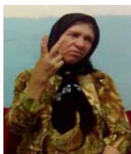
(الف) نشانه‌ی دو